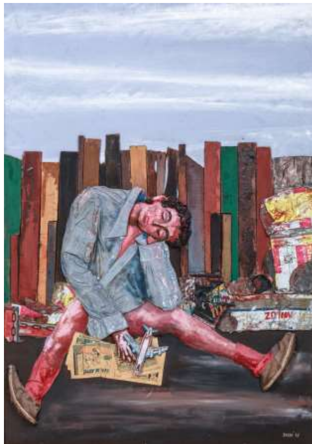
“JUANITO DORMIDO” 1978 - Medidas: 157 x 111,5 cm

¿Qué imaginan que hará Juanito cuando despierte?