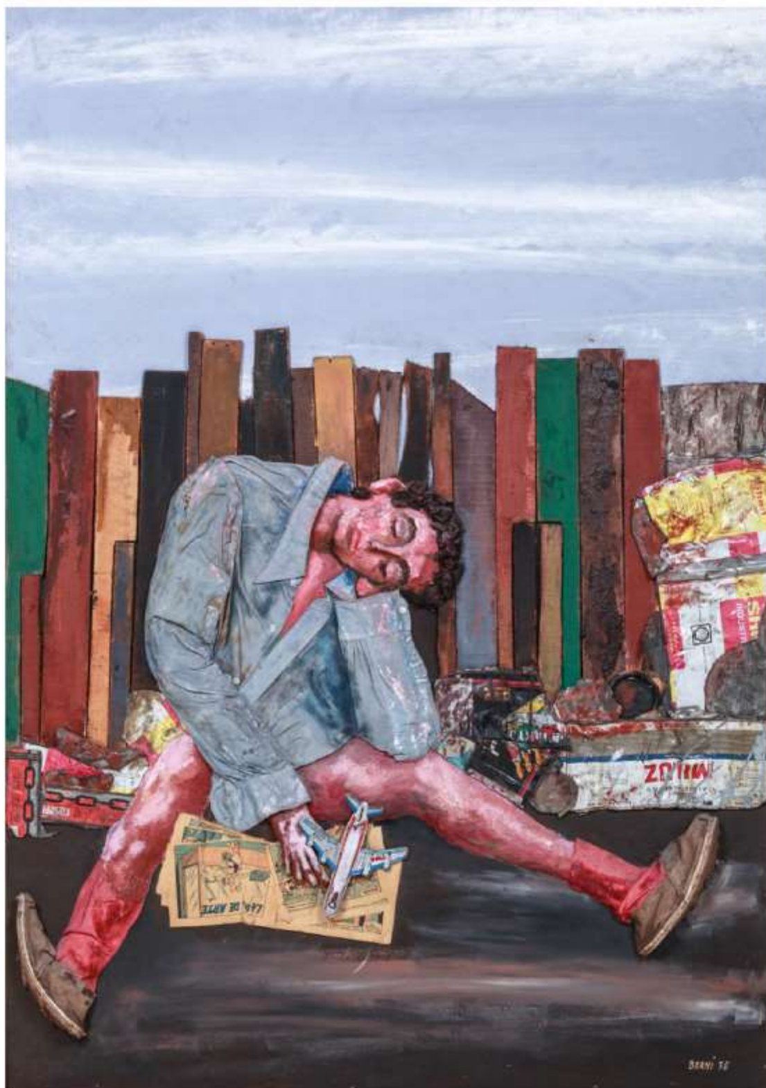
"JUANITO DORMIDO" 1978 Medidas: 157 x 111,5 cm